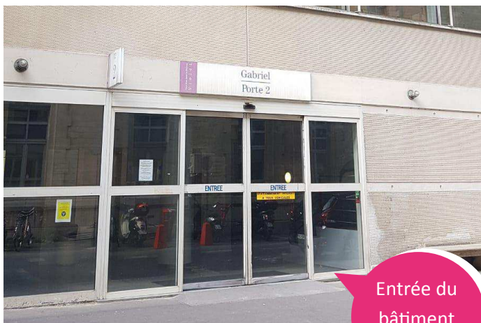
Entrée du bâtiment